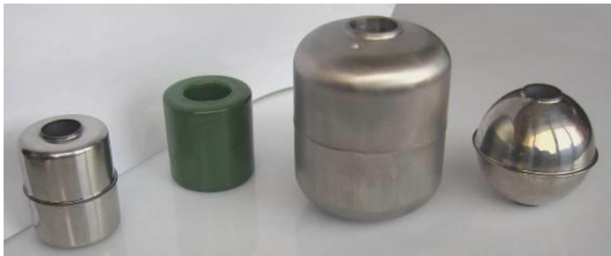
Рисунок 3 – Примеры исполнения поплавка