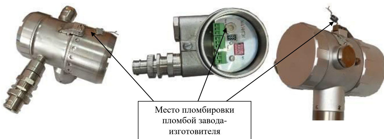
Рисунок 2 – Схема пломбировки электронного блока преобразователя от несанкционированного доступа, обозначение мест пломбировки пломбами завода-изготовителя